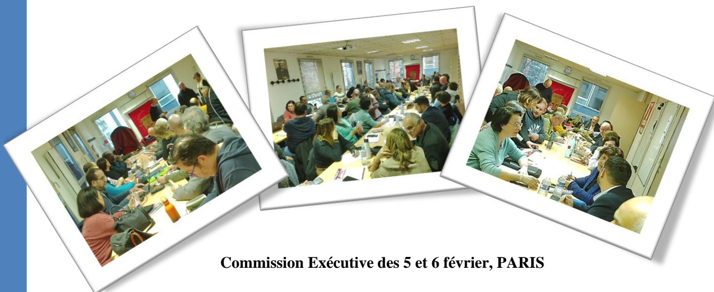
Commission Exécutive des 5 et 6 février, PARIS

L'accord sur le travail de nuit dans les UGECAM, qui lui a été signé par FO, a quant à lui vu son agrément intervenir le 31 janvier.